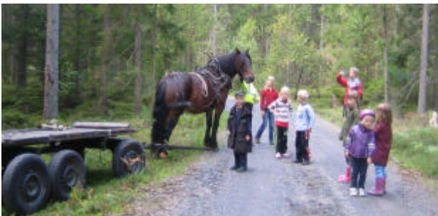
En av de duktiga körhästarna tillsammans med en stor barnskara som också deltog under skogsdagen.