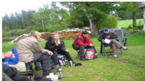
Här pausar vi med lite fika.